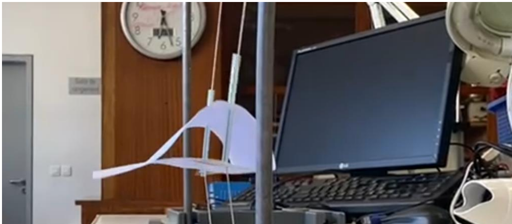
Mise en place de l'expérience