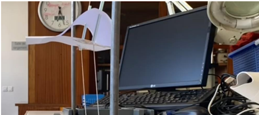
Observation de l'expérience